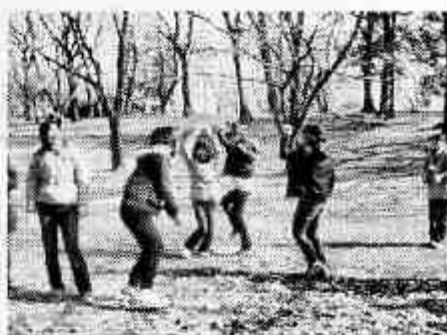
感じたことを体で表現