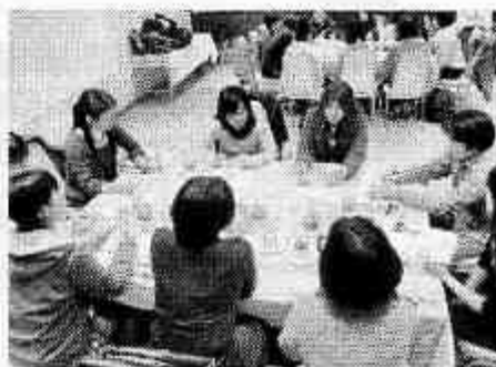
グループワークショップ