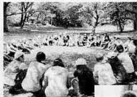
グループワークショップ

夏の公園にある自然物(枝・葉っぱなど)を活用して、グループ毎に想像上の生き物を製作します。様々な造形を楽しみましょう。気づかせる声掛けを少し変えるだけで、自然との関わり方や見方を変えることができます。普段は通り過ぎてしまっているものとの向き合い、そこから感じたことを自然物で形にして表現します。