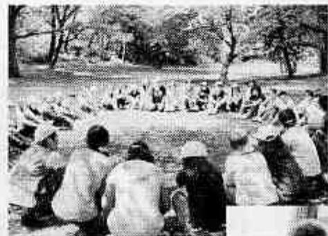
グループワークショップ

夏の公園にある自然物(枝・葉っぱなど)を活用して、グループ毎に想像上の生き物を製作します。様々な造形を楽しみましょう。気づかせる声掛けを少し変えるだけで、自然との関わり方や見方を変えることができます。普段は通り過ぎてしまっているものとの向き合い、そこから感じたことを自然物で形にして表現します。