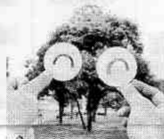
森の展覧会～ニコニコさん～