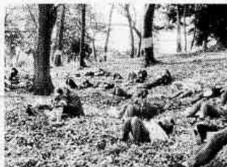
～心ほくし休ほくし～