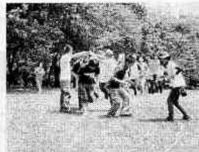
子どもの動線を考えたロープの電車

丸型に形取った画用紙に目玉を書き込み、公園に隠れているお顔を見つけにいきます。大きな額を用意して、はめ込めば森の展覧会の始まりです。