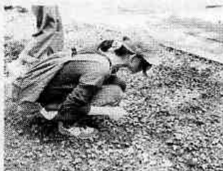
夏の生き物と向き合う時間