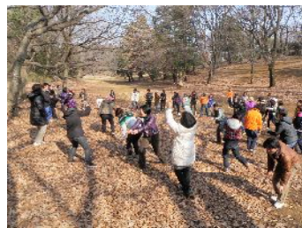
体で表現してみよう

自然あそびの中で、発見したものや感動したことが、子ども（乳児・幼児）たちの中にたくさん生まれます。指導者が、それを読み取り、一緒に共感したり一緒に体験したりすることで、子どもたちが安心して発見や感動を、言葉や動きや音にして、表すことが出来るようになります。