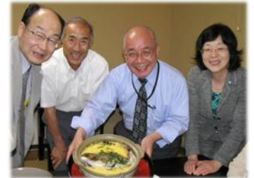
2011年6月、新潟県柏崎市の園長先生たちと当地名物の「鯛めし」で語り合う。

4年間の北島三郎専属バンド楽団員生活で放浪人生が身につく、これまでに訪ねた私立幼稚園は2600園を超えた。楽団の後は神奈川電通、全私学新聞、全国学校法人幼稚園連合会、昭和女子大学での修行を経て1995年に幼稚園情報センターを設立、現在に至る。その間、全日私幼連インファントピア事務局、愛知県私立幼稚園連盟事務局長も務めた。